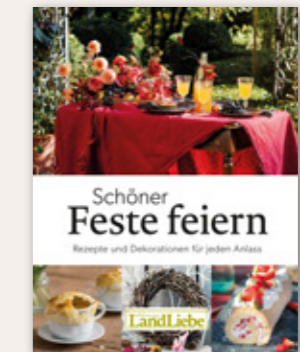
Diverse Autoren Schöner Feste feiern – Rezepte und Dekorationen für jeden Anlass 210 Seiten, Hardcover, CHF 38.– ISBN 978-3-906869-40-7