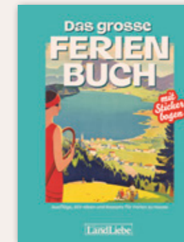
Diverse Autoren Das grosse Ferienbuch – Ausflüge, DIY-Ideen und Rezepte für Ferien zu Hause 208 Seiten, Hardcover, CHF 48.– ISBN 978-3-906869-49-0